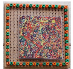
Art by groep 1/2