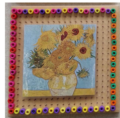
Art by groep 1/2