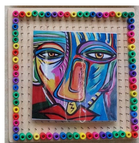
Art by groep 1/2