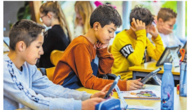
Leerlingen van OBS Van Maasdijschool aan het oefenen voor het Nationaal Verkeersexamen.

Onderwijzeres Link: „Wij zijn aan het begin van het schooljaar al begonnen met de vaste theorielessen, minimaal één keer per week. Naast de theoretische stof hebben we ook verschillende projecten. Zo leren de kinderen hoe ze moeten handelen in verschillende situaties op zowel de fiets als in een auto via een simulator. Ook hebben ze een gastles gevolgd omtrent het telefoongebruik in het verkeer. De basis moet stevig zijn.“